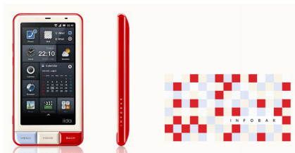
au iida INFOBAR A01